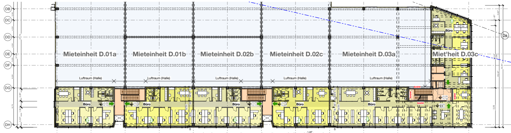
Grundriss 1.OG | Übersicht